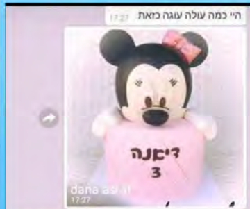
היי כמה עולה עוגה כזאת 450, ה"י 17:27

הרגע המביך הזה שאתה קולט שהפסיק לרדת גשם ואתה היחיד שהולך עם מטריה פתוחה ברחוב