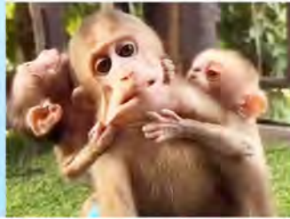
בניית המצלמה הראשונה בעולם?