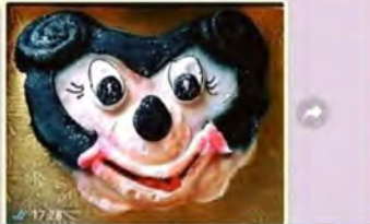
יש ב2000? 17:28

יש מקום שמור בגיהנום לאנשים שמכניסים לך אצבע לפה כשאתה מפקח