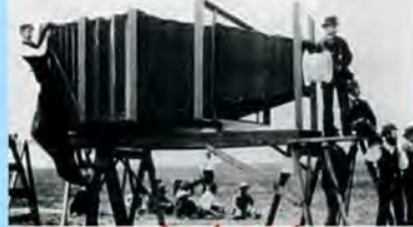
אז מי צילם את זה?

היום הסתכלתי על אשתי וחשבתי, זוהי ההשקעה היחידה שהכפילה את עצמה במהלך החיים.