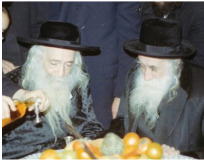
רבי יהודה בויאר CC BY SA 4.0 בני ברק

מסבך קצת... בימים הראשונים הסתפק אברהם אם יתמיד במתכנת הזו של חצי יום למודים בישיבה. אולי לא מתאים לו ללמד תורה כה הרבה שעות? אולי עדיף לו לצאת לעבד יום שלם, ורק בערב ללכת לשעור תורה בצרפתית, כמו שעושים מרבית בני משפחתו?