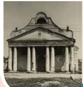
חזית בית הכנסת בסובולק

בכ"ט בחשון תרי"ג, והוא בן ששים וארבע, הסתלק לבית עולמו ונטמן בעיר רבנותו האחרונה - סובלק. בהתאם לצוואתו שלא לכתב עליו שבחים, נכתב על מצבתו כך: "אשר איש פקדתו שמה מחסום לעט, וסגר ליד חוקקת לקצר מהללו ולמעט בתואריו..."