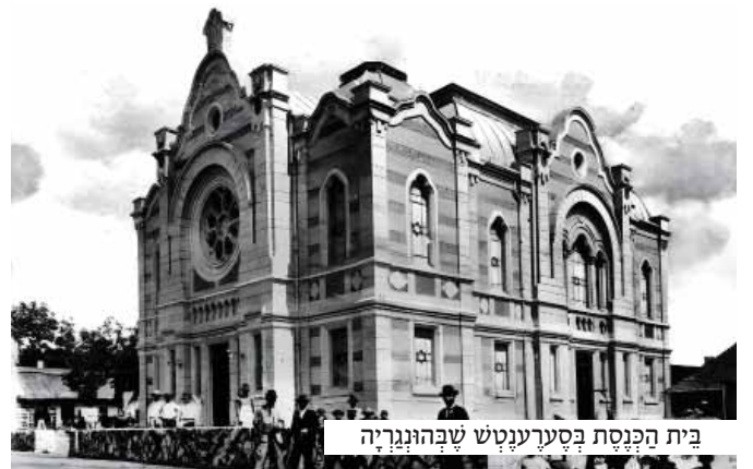
בית הכנסת בסערענטש שבהונגריה